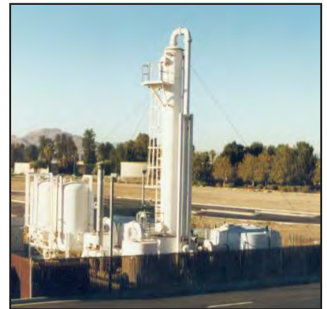
Este sistema de bombeo y tratamiento fue utilizado en la antigua base aérea Norton en el estado de California.